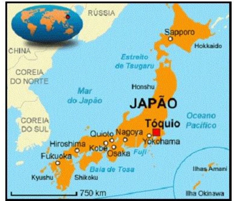
Mapa do Japão

País insular, tem uma área de 377.000 km 2 e é a terceira economia mundial.